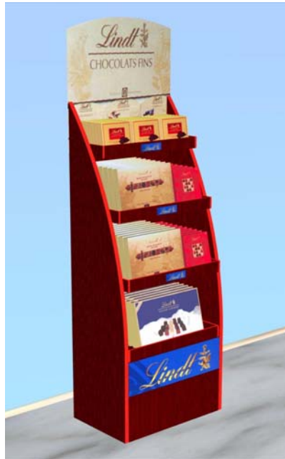
Display Beispiel Holz

In Material - kombination Holz Glas Metall Kunststoff mit Beleuchtung